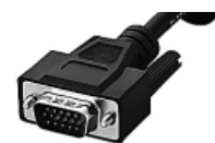
接続ケーブル側(オス)