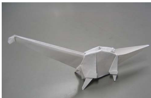
ブラキオサウルス