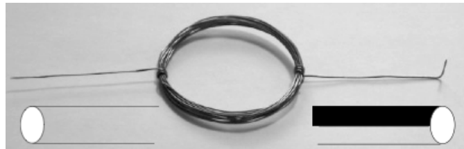
エナメルをぜんぶはがす