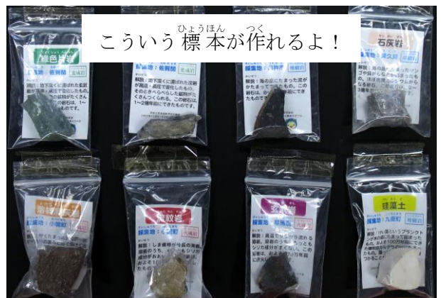
こういう標本が作れるよ！