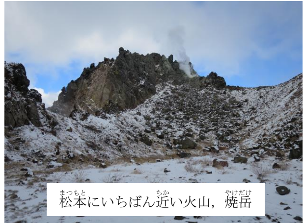
まつもと 松本にいちばん近い火山、焼岳

おんたけさん 御嶽山も火山です。御嶽山以外にも長野県やその周辺にはたくさんの火山があります。